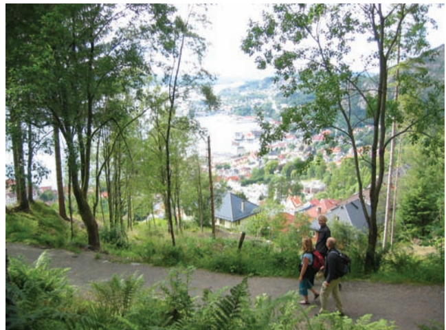
På veg ned Tippetue. Få område har fleire brukarar enn byfjella i Bergen.

Arbeidet vart avgrensa til å omfatte nasjonale og regionale friluftsområde. Det dreier seg i hovudsak om areal i Landbruks- natur- og friluftsområda (LNF-områda) i kommuneplanen, ikkje areal i byggeområde og andre tettbygde område. Mindre, tettstadsnære område som grønstruktur og andre område som ofte er viktige for barn og unge vart haldne utanom, sjølv om slike areal har spesiell fokus i den nasjonale areal- og friluftslivpolitikken.