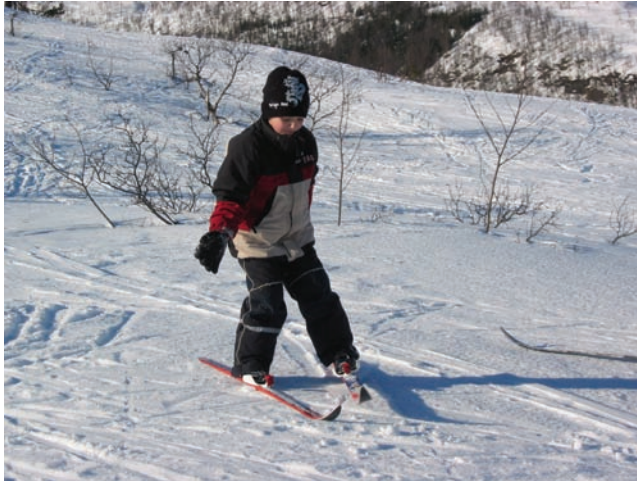
Å ta vare på barn sine leikeområde er viktig i den kommunale planlegginga.

Registreringane frå prosjektet kan takast i bruk som grunnlag for planlegging slik det no ligg føre. Grensene har ikkje juridisk verknad før kommunane eventuelt legg dei inn i arealplanar i medhald av plan- og bygningslova, som reguleringsplanar eller kommuneplanar. Materialet er kopla mot arealforvaltning og planlegging og er ikkje retta inn mot turplanlegging.