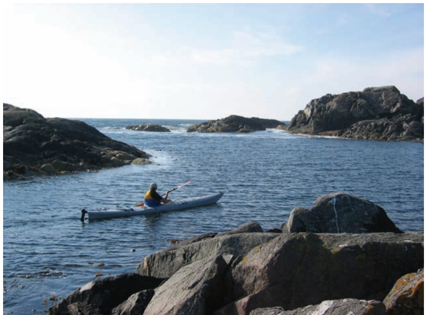
Hordalandsskjergarden er eit eldorado for padling. Frå Austrheim.

Det vert ikkje gitt detaljert skildring av kvar kommune og kvart område i denne rapporten. Data er tilgjengeleg på kart og i eigenskapstabell på internett. Dei ligg også som vedlegg til denne rapporten som illustrasjon.