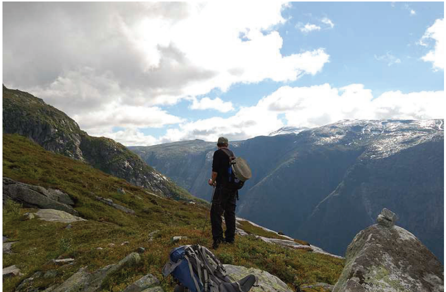
Hordaland har mange storslåtte fjellområde. På veg opp frå Kjeåsen, Eidfjord.

Undervegs i prosessen og etter høringsrunde i kommunane vart fleire områdegrensar justerte.