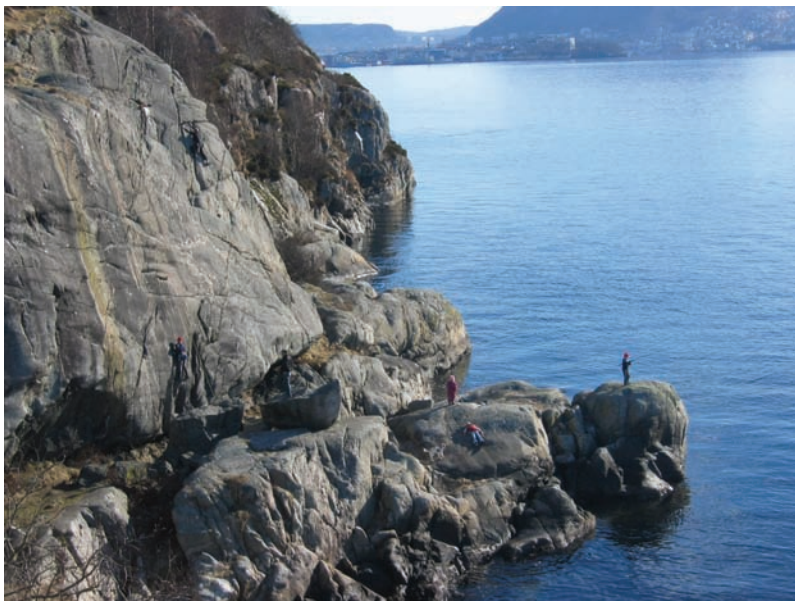
Hellneset i Bergen, eit område med fleire funksjonar: klatring, fisking, bading og soling.

Kartleggingsarbeidet er gjennomført etter metode skildra i Håndbok 25-2004