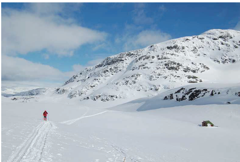
Skituren mellom Kvamskogen og Hamlagrø er ein klassikar.

Omgrepet regionale friluftsområde er her nytta om område med stort nedslagsfelt og mange brukarar, anten totalt eller i forhold til folkemengda i regionen. Brukarane kan kome frå fleire kommunar. Det dreier seg i hovudsak om større, samanhengjande tur- og naturområde langs kysten, i skogen eller i fjellet, men kan og vere mindre område med spesielle kvalitetar som gjer at dei har regional verdi. Typiske regionale friluftsområde i fjellet er Kvamskogen og Sysendalen, inkludert tilkomstkorridorar og