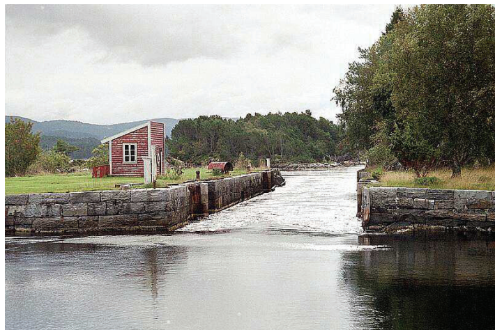
Den indre farleia med Lindåsslusane: regionalt friluftsområde med potensiale for reiseliv.

GIS-ekspertise frå fylkeskommunen er trekt inn i arbeidet.