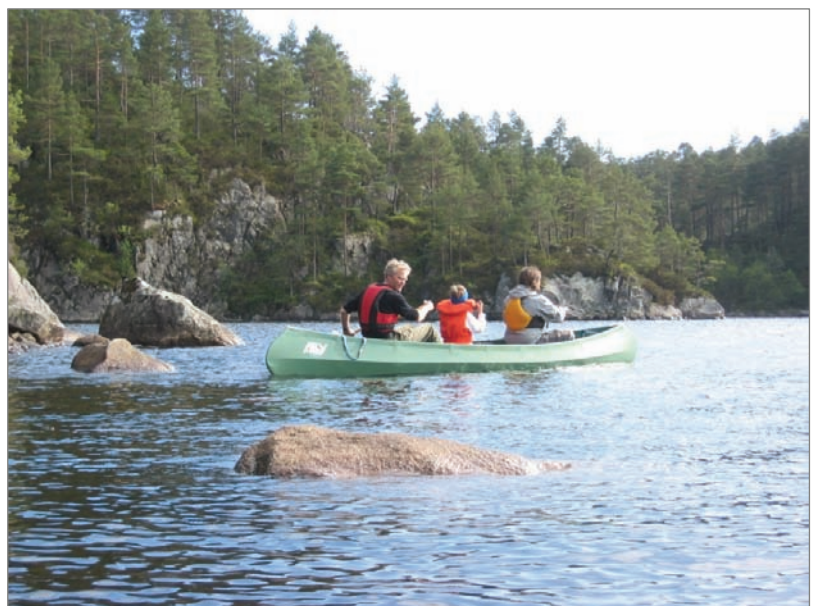
Kanopadling er ein fin familieaktivitet og Flatråkervassdraget på Tysnes eit veileigna område.

Det vil vere naudsynt å arbeide vidare med å betre kunnskapsgrunnlaget om folk sin bruk av friluftsområde. I denne samanheng vil det vere nyttig å trekke inn lokale turlag, velforeiningar og andre brukargrupper for å få ein grundigare gjennomgang av ulike areal sin verdi for friluftsutøving lokalt og regionalt.