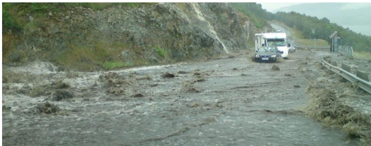
Figur 1 Flaum på E39/Mehammer i 2009.

Kommunedelplan for overvatn skal ivareta kommunen sine interesser, sektoransvar og mål knytt til forvaltning av overvatn. Det vil bli utarbeidd temakart med omsynssoener i samband med arbeidet (til dømes for flaumvegar og flaumsoner).