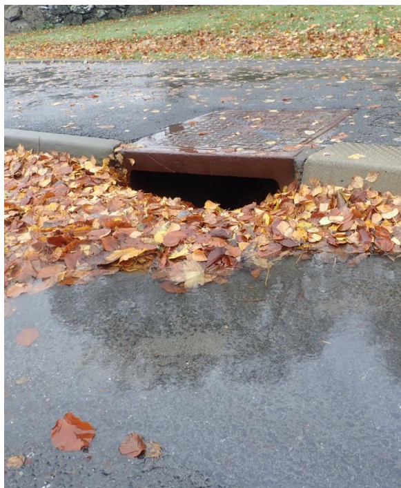
Figur 3 Kjeftesluk i Hystadvegen som snart er tetta av lauv.

Auke i nedbørmengd og -intensitet vil gje auka belastning på eksisterande infrastruktur for overvatn. Konsekvensen, og handtering av dette skal skildrast i kommunedelplanen.