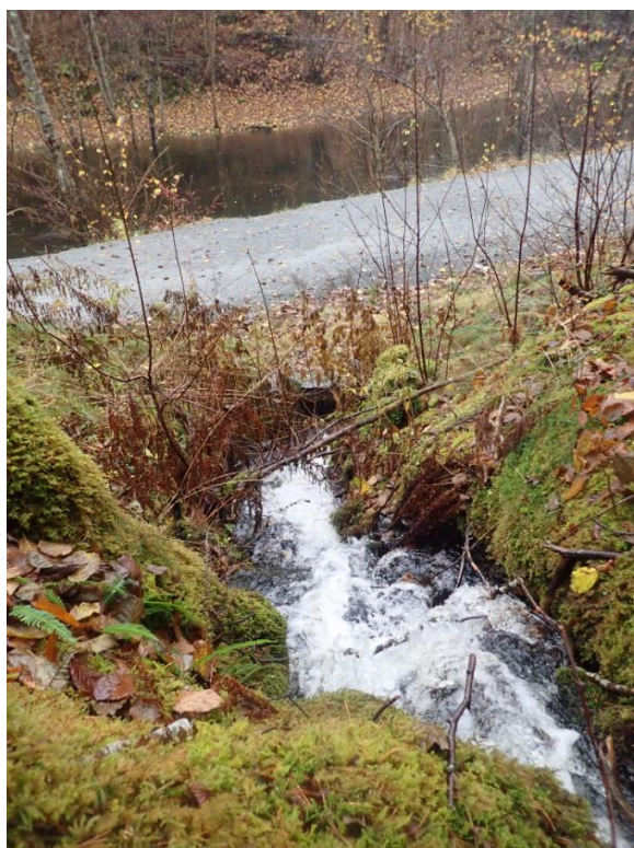
Figur 5 Røyr under turvegen langs Frugardselva.

Det er behov for eit visst kunnskapsnivå om nedbør, avrenningstilhøve i nedbørsfelt, tiltaksmoglegheiter og fare for skade. Det er difor viktig å ha oversikt over avrenningslinjer for overvatn og å kartlegge område som er sårbare for skade.