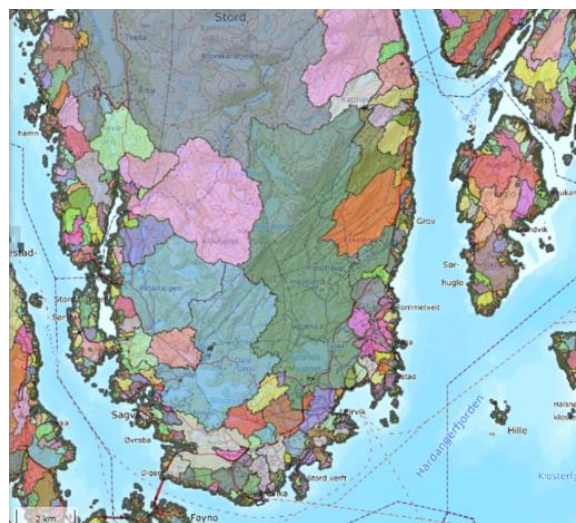
Figur 6 Nedbørsfelt på Stord.

Kartlegging av desse er ressurskrevjande, men nødvendig. Avrenningslinjer vil vere grunnlag for planlegging av flaumvegar og kartlegging av risikoområde for flaum. Viktige elver, bekker og bruer skal òg inkluderast i kartlegginga.