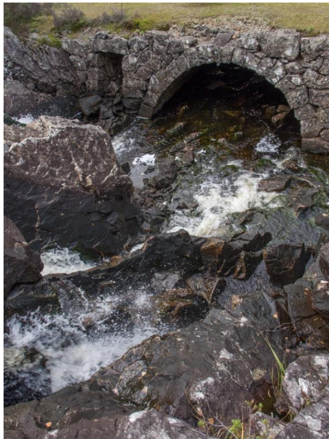
Figur 7 Bru under Fitjarvegen ovanfor Dåfjorden.

Vurdere kartlagde avrenningslinjer i eksisterande grønstrukturområde i kommuneplanen som aktuelle område for blågrøne løysingar.