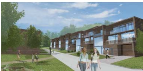
Figur 7 Døme på arkitektur - lettare konsentrert

Bygeområda ein utviklar innan bydelscenteret bør vere godt utforma med ein velutvikla arkitektur som vil prege og gi form til Leirvik som by og tettstad, samtidig må det setjast krav til arealeffektivitet og utnytting. Det må og setjast kvalitative krav til gode felles uteområde. Desse bør vere parkmessig opparbeidde, romslige og utstyrt med turstiar og areal for lek og aktivitet. Alt dette krev rammer og god styring og det set faglege høge krav til planverket som blir utforma.