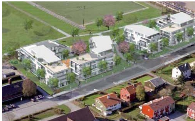
Figur 8 Døme på arkitektur - tyngre konsentrert