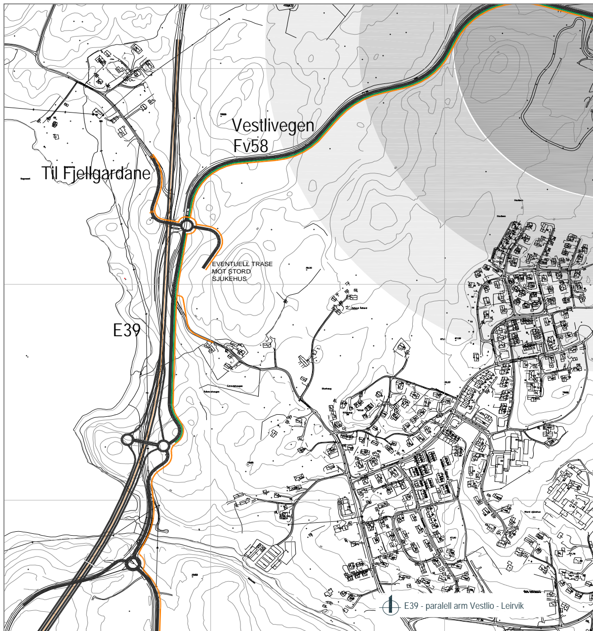
Figur 5 Ny linje E39 med parallell arm mellom Vestli og Leirvik

Valdaivegen - Prestavegen - har ein historisk og kulturell verdi som hovudsamband mellom Prestegarden på Tyse og Stord kyrkje fram til midt på 1800 talet. Vegen dannar ein diagonal gjennom det sentrale framtidige bydelssenteret, tangerer to skular og eit større aktivitetsområde og er såleis interessant også som framtidig opprusta gang- og sykkelveg. Men ein må sjølvstakt ta vare på dei kulturhistoriske verdiane under ei slik oppgradering. Vegen bør, ikkje minst for si historiske betydning, gjerast samanhengande der den er broten og førast over Veslivegen ved bru.