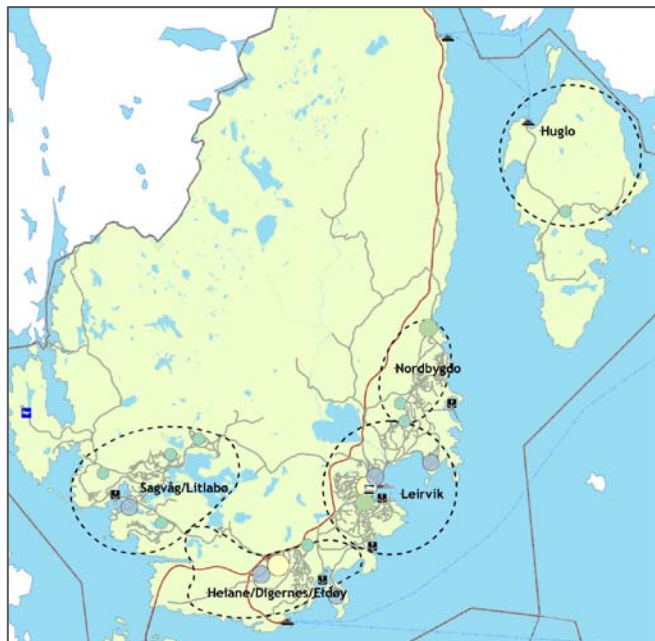
Figur 1 Dei 5 områda for bydelscenter i Stord (Akvator-2009)

(Hystad/Rommetveit) er i hovudsak prega av bustadområde med nokre bydelsrelaterte tilbod. Bydelen har idrettsanlegg, post i butikk, barnehagar, grunnskulane Hystad og Rommetveit, Nordbygdo ungdomsskule og Høgskolen Stord/Haugesund. Delar av området er jordbruks- og skogsområde.