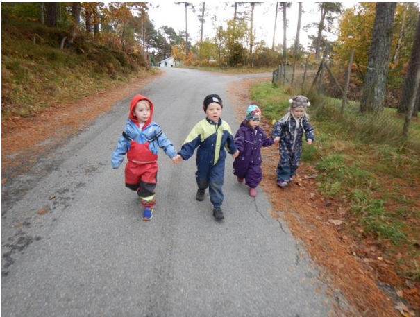
Me går saman hand i hand.