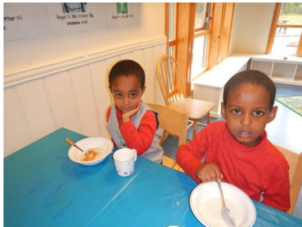
Grøt smakar godt 😊