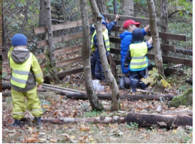
Barna si medverknad