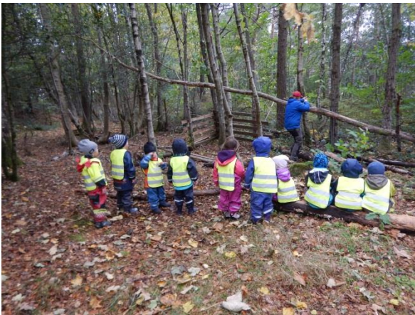
Nadine sagar ned eit tre