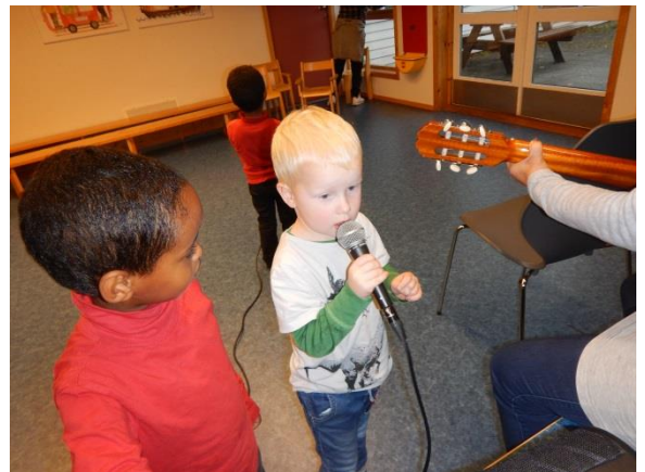
Kjekt å synge i mikrofon