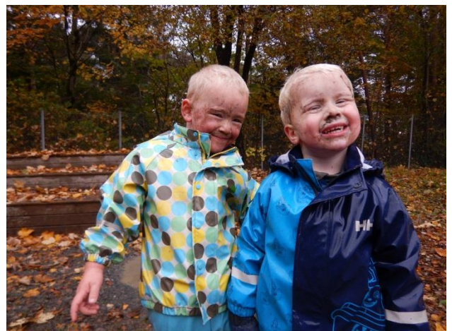
«.... Vi hopper i vann.....»