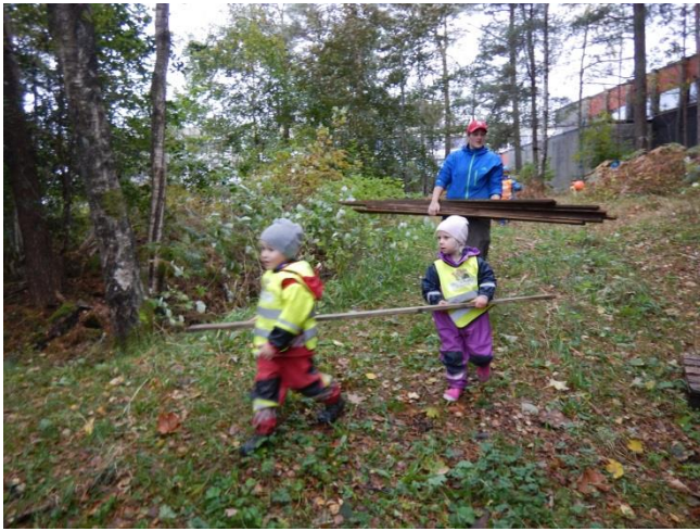
Ny hytte på gang.